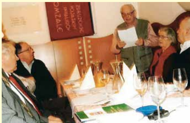
Na zboru članov DVI Domžale.