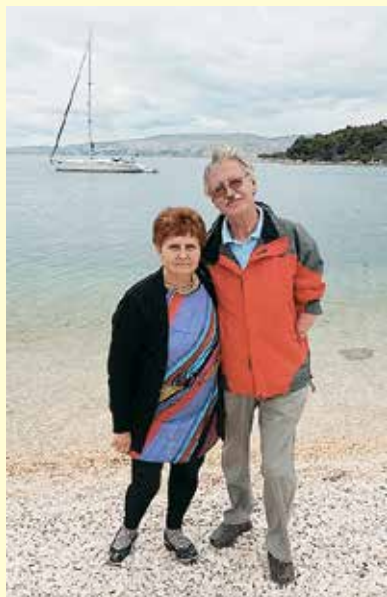
25. maj 2015 - Dan mladosti na Golem otoku

27. marec 2015 - Predavanje: Hrbtenica in predstavitvev načinov zdravljenja