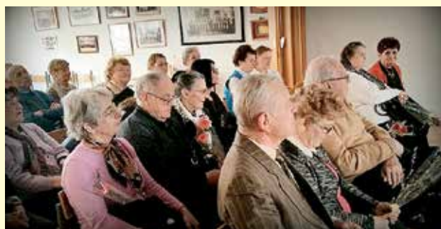
9. marec 2015 – Proslava ob dnevu žena in dnevu 40. mučenikov