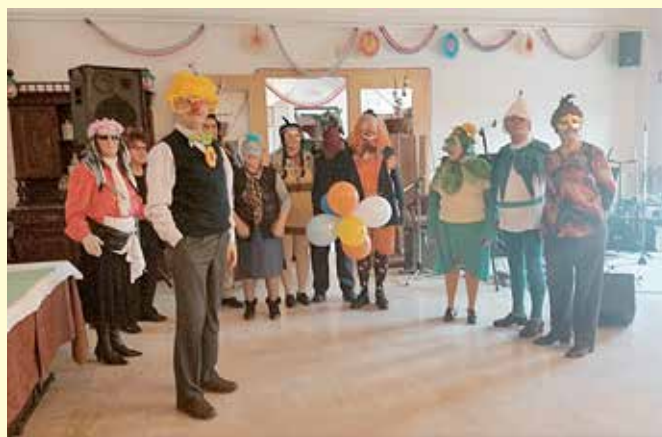
17. februar 2015 – Pustovanje v Kostanjevici na Krki z ogledom muzeja in razstave na temo: » Pust skozi čas «.