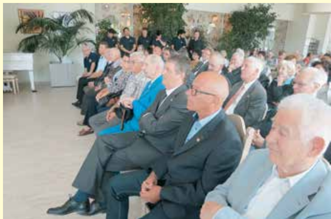
Društvo vojnih invalidov Celje je s slovesnostjo zaznamovalo 20. obletnico delovanja društva.

zirje. Med NOB je bil zelo aktiven borec, v povojnem času pa ploden pisatelj, z izjemnim občutkom za opisovanje svojega in življenja drugih med NOB ter zato dragocen pričevalec časa. Izdal je več knjig, med njimi tudi: » Moji spomini «, spomini Alojza Volerja na leta pred odhodom v partizane in po vojni .