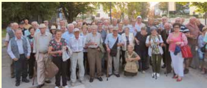
Za slovo smo se slikali pred fontano v Žalcu.