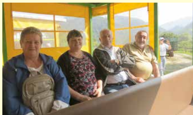
Pa smo šli. Z vlakcem v biološko učilnico.

Cerkev sv. Jurija je bila najverjetneje zgrajena že v 9. stoletju, zdajšnja pa je kot cerkev z romansko zasnovano nastala v drugi polovici 13. stoletja in je značilna predstavnica »koroškega tipa« romanskih cerkva z vzhodnim zvonikom. V njej je ohranjenih kar nekaj elementov, ki kažejo na različne stavbne gradbene faze, saj je bila deležna več prezidav in obnov. Jeseni leta 1993 so arheologi iz Maribora ob zamenjavi dotrajanega tlaka v podružnični cerkvi Sv. Jurija na Legnu naleteli na ostanke starejših sakralnih objektov in grobove. Med omenjenimi arheološkimi raziskavami so odkrili dve starejši gradbeni fazi: predromansko