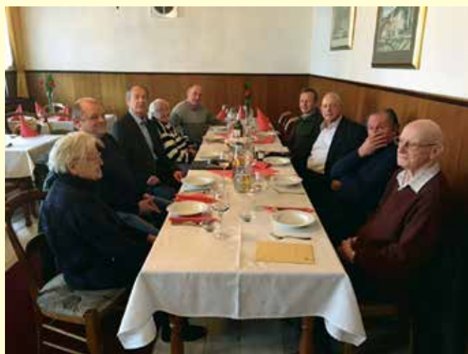
S srečanja pododborov Slovenske Konjice.

V nadaljevanju je sledilo poročilo o delu v preteklem letu. DVIC, ki ima 209 članov, od tega 36 pridruženih, deluje v skladu s Programom dela Zveze društev vojnih invalidov Slovenije (ZDVIS), vsebinsko pa izvedbo prilagaja svojim lokalnim razmeram, posebnostim in možnostim. Kot je povedal predsednik društva, se je skozi leto število naših članov zmanjšalo za 14, statistika pa kaže, da še vedno 40 odstotkov