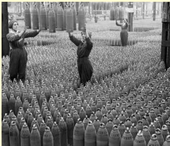
Medvojno delo v britanski tovarni granat.